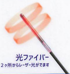
光ファイバー 2ヶ所からレーザー光がでます